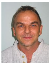
Martin BENKE Photographe